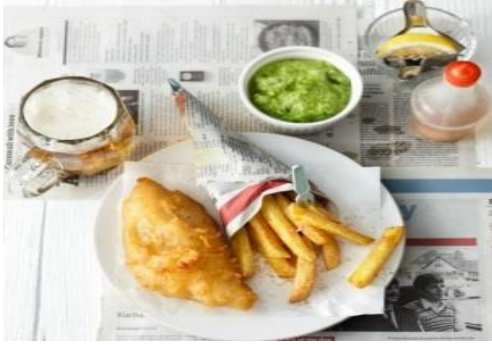
Fish and Chips