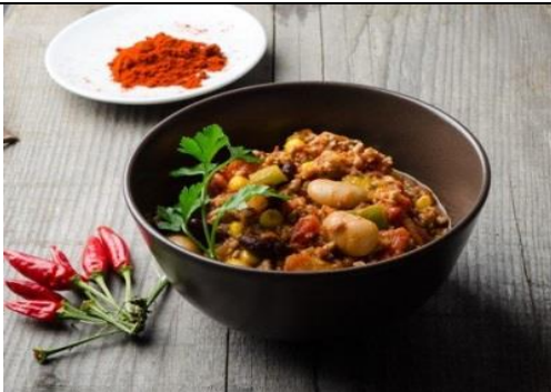
Chili con carne